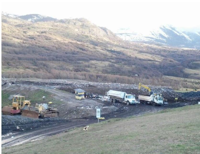
Vista general de las trincheras del CEMARC