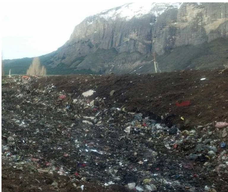
Estado de cobertura del frente de trabajo a pesar de los 100 mm caídos en 30 horas el día